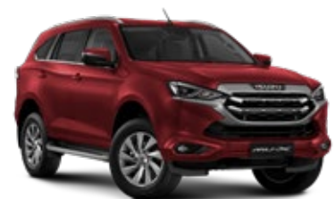
Red Spinel Mica