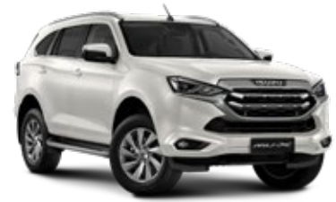
Dolomite White Pearl