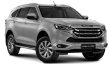
Mercury Silver Metallic