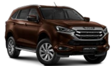
Santos Brown Mica