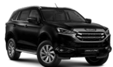
Onyx Black Mica